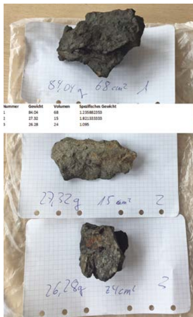
Genaue Daten werden erhoben.