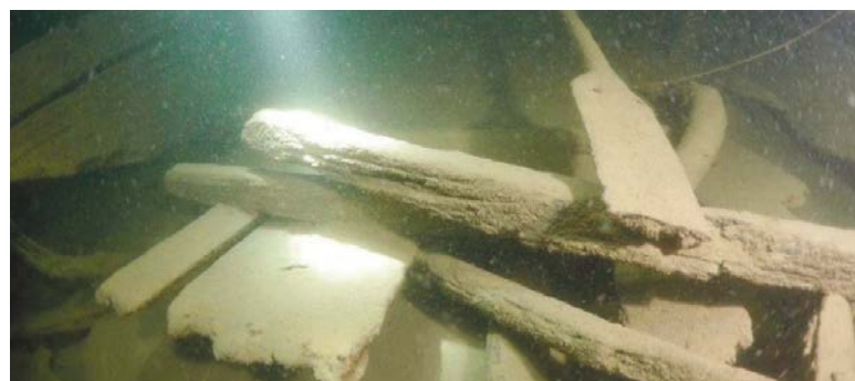
Ruder und Mast brachen beim Unglück.

Sekundarschulhaus an der Bublikonerstrasse erwerben und sich dort niederlassen konnte. In den beiden Weltkriegen wurde eine Wiederaufnahme der Kohlegewinnung in Dürnten in Erwägung gezogen und schnell verworfen. Die Schieferkohle bleibt indessen ein wichtiger Teil in der Geschichte der Gemeinde Dürnten.