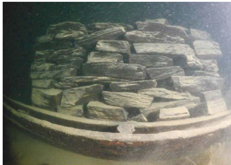
Die Ladung des (Dürntner-)Wracks.