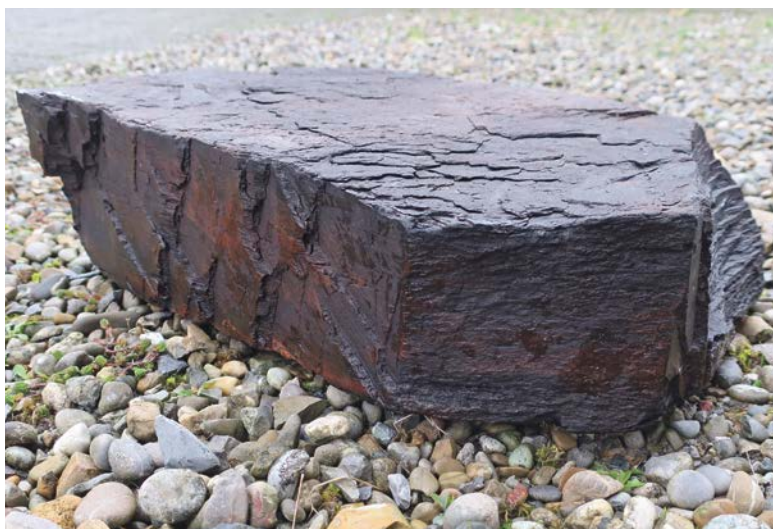
Die Bearbeitungsspuren links könnten Hinweis auf die Herkunft der Kohle sein.

Im September schrieb Adelrich Uhr von den «Swissarcheodivers» eine Meldung an die Ortskundliche Sammlung Dürnten: «Dieses Jahr be-tauchten wir im Zürichsee vier gesunkene Schiffe zum ersten Mal. Eines dieser Wracks ist ein Ledischiff mit einer Länge von 18 und einer Breite von etwas mehr als drei Metern. Es ist in den Jahren zwischen 1850 bis 1870 vor Wädenswil untergegangen. Die ganze Ladung von ungefähr 14 Kubikmetern besteht aus Schieferkohle. Sie stammt vermutlich aus Uznach/Schmerikon oder aus Dürnten. Gerne würde ich mit zwei gehobenen Platten bei Ihnen vorbeikommen...»