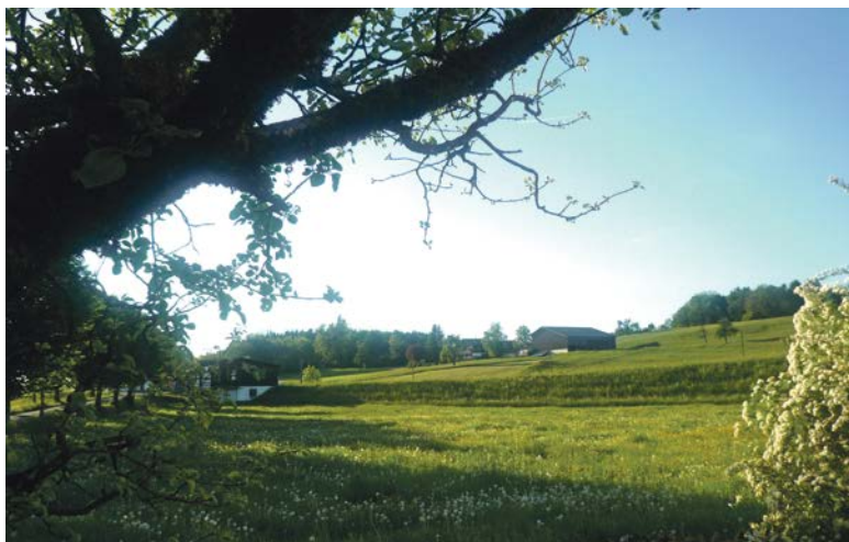
Der Oberberg mit dem Bauernhof, wo die Kohle gelagert wurde

1836 war die Zahl der Bezüger auf 120 angewachsen; das Graben am Oberberg musste organisiert werden. Der Gemeinderat bildete Rotten mit je einem Rottmeister und einem Aufseher zur Überwachung der Arbeiten. Es mussten riesige Mengen von Kies und Lehm über der 60 bis 150 Zentimeter dicken Kohleschicht abgetragen werden, wobei auch oft Wasser austrat. Das war gefährlich: Zwei Männer verunglückten tödlich, als die hohe Abbauhalde ins Rutschen kam. Das Staatsgebiet war 1843 vollständig ausgebeutet. Bis dahin war auf einer Fläche von einer halben Hektare Kohle im Gewicht von über 5300 Tonnen gewonnen worden. Zwar gelang es dem Kanton, auf enteignetem Land den Tagbau noch ein paar Jahre weiterzuführen. Im Jahre 1849 musste dieser aber definitiv aufgegeben werden.