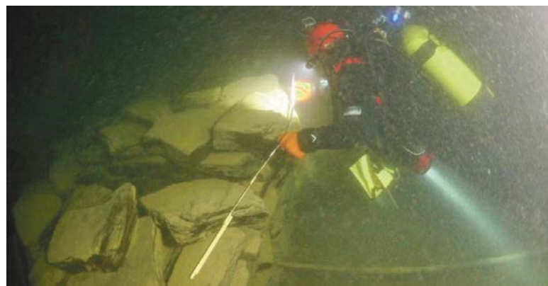
Genaues Ausmessen beim Tauchgang.