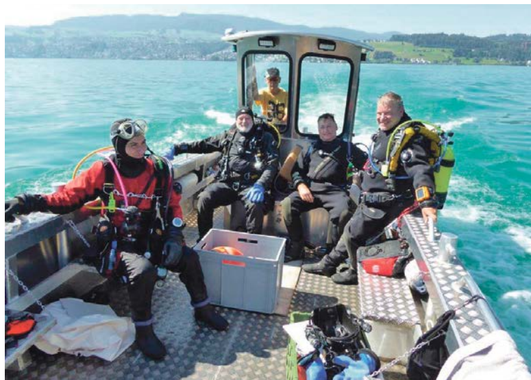
Die Archeodivers fahren aus.